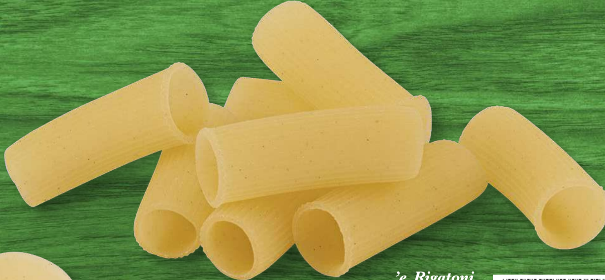
'e Rigatoni senza glutine