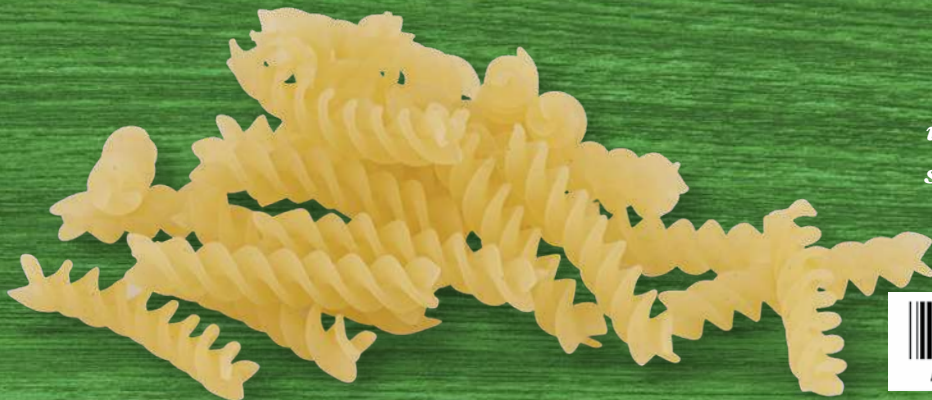
i Fusilli corti senza glutine