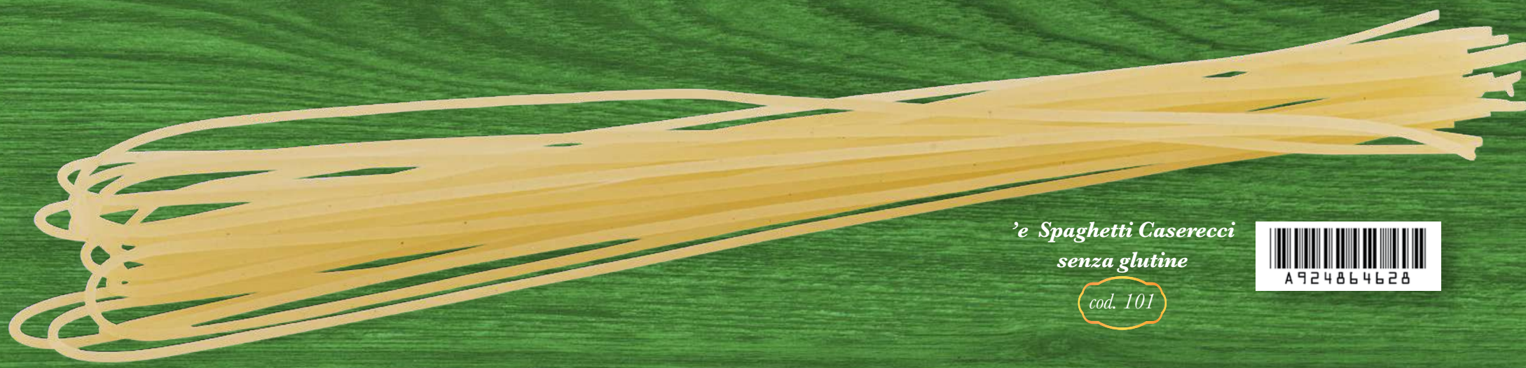
'e Spaghetti Caserecci senza glutine