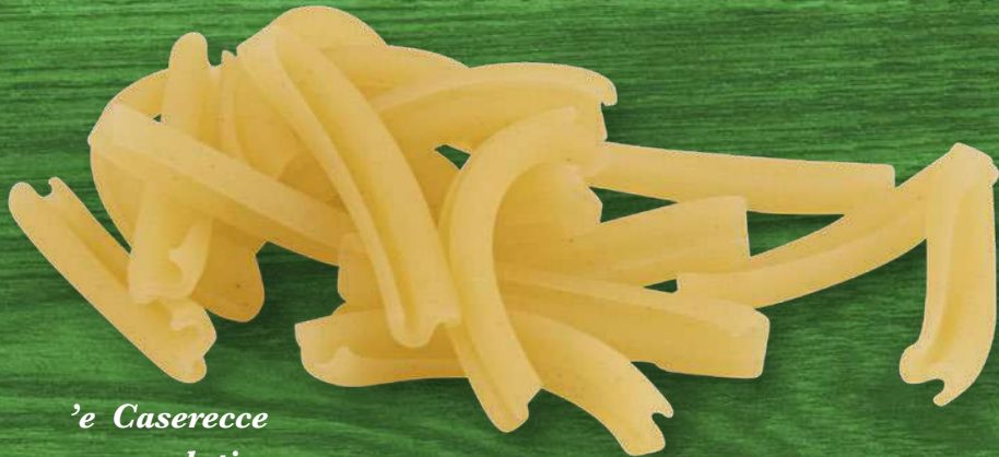
'e Caserecce senza glutine