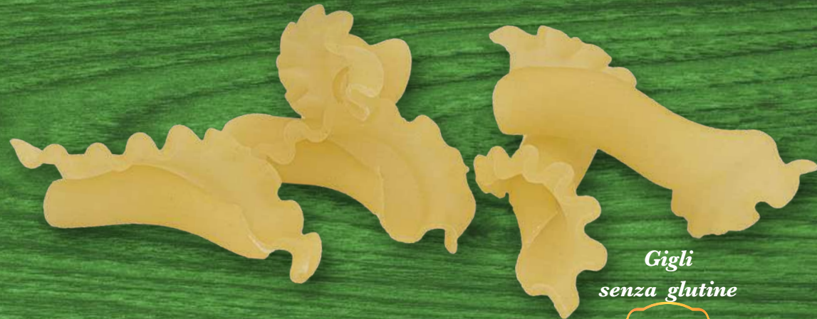
Gigli senza glutine