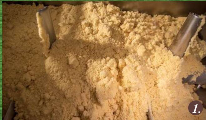
Impasto delle farine di mais e riso con l'acqua di Gragnano Rice and corn flour dough with Gragnano's water

The semolina was mixed with clear Gragnano water in a kneading trough and then further compacted to achieve a uniform dough. Initially operated by hand and later mechanically, the presses shaped the dough through bronze dies under the watchful supervision of the pasta maker. The pasta was dried in the open air on bamboo canes, utilizing the winds from the Lattari Mountains and the Gulf of Sorrento, with the pasta maker meticulously monitoring every stage of the process.