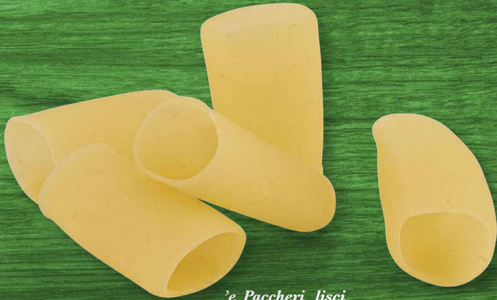
'e Paccheri lisci senza glutine