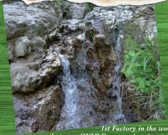
1st Factory in the world that uses ONLY Gragnano's spring water cert. GO.RI. 24186085274

il primo Pastificio ad usare SOLO acqua di sorgenti di Gragnano