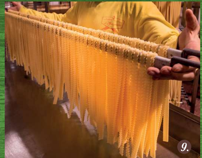
L'asciugatura, fase molto lunga e delicata a bassa temperatura Drying process, very long and delicate at low temperature