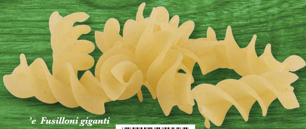
'e Fusilloni giganti senza glutine