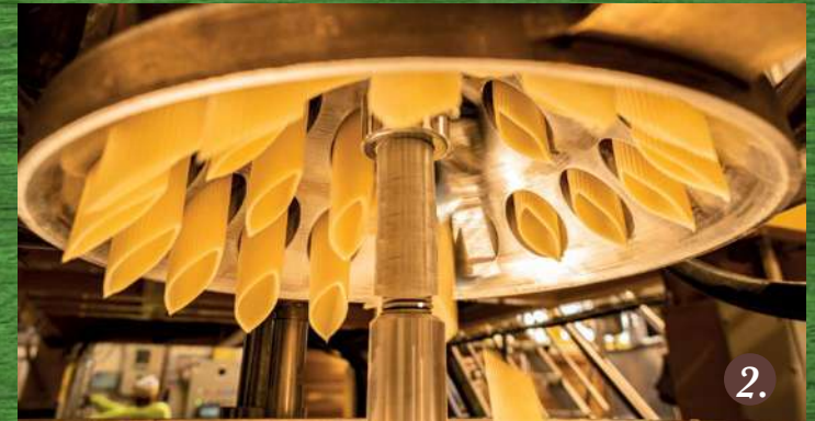
Momento del taglio a punta Cutting of pasta "pointed style"