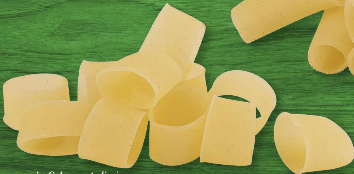
'a Calamarata liscia senza glutine