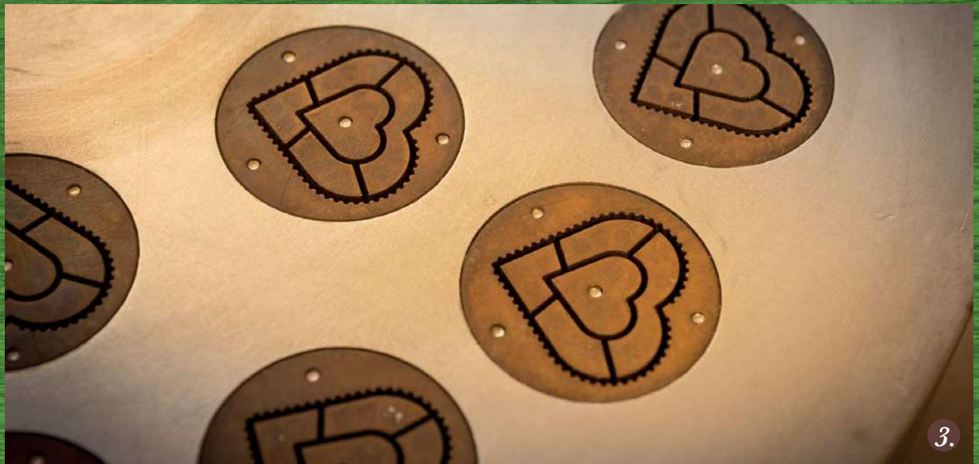
Trafila al bronzo - Bronze die