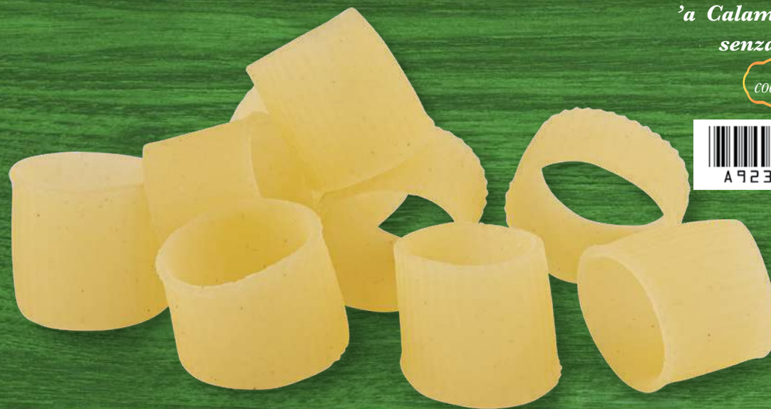
'a Calamarata rigata senza glutine